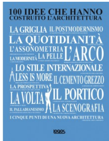
100 IDEE CHE HANNO COSTRUITO L'ARCHITETTURA