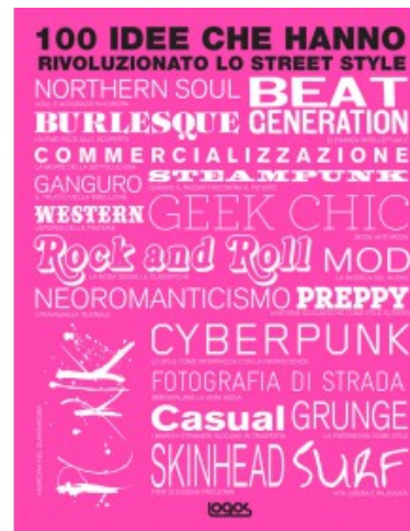
100 IDEE CHE HANNO RIVOLUZIONATO LO STREET STYLE