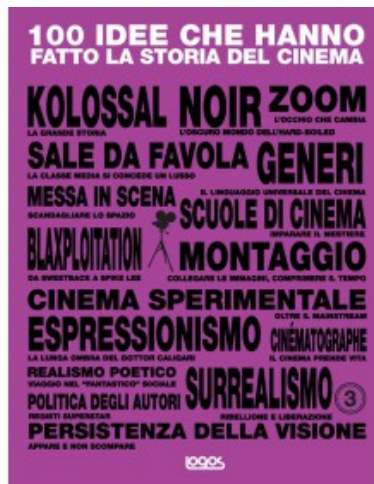
100 IDEE CHE HANNO FATTO LA STORIA DEL CINEMA