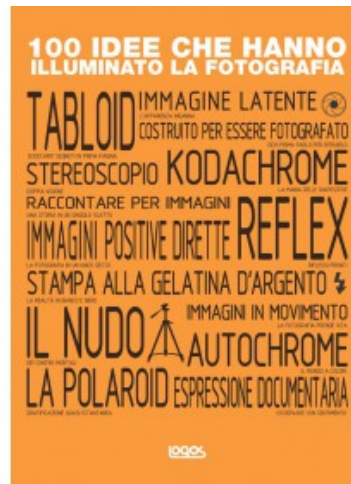
100 IDEE CHE HANNO ILLUMINATO LA FOTOGRAFIA