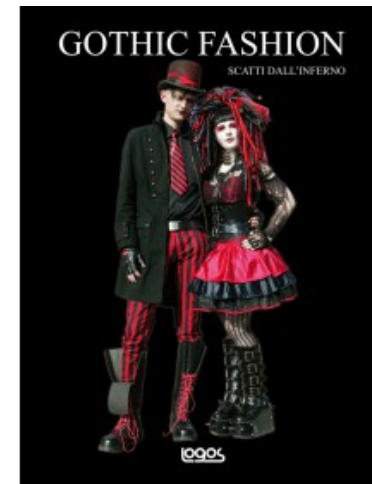
GOTHIC FASHION. SCATTI DALL'INFERNO