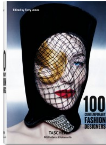
100 CONTEMPORARY FASHION DESIGNERS (IEP)