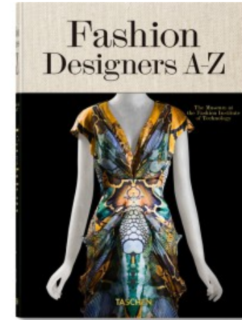
FASHION DESIGNERS A-Z Valerie Steele, Suzy Menkes 9783836572507 30,00€