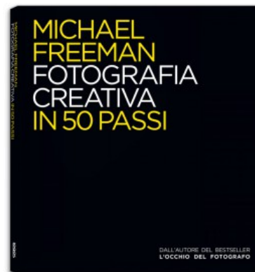
MICHAEL FREEMAN. FOTOGRAFIA CREATIVA IN 50 PASSI