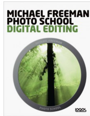
MICHAEL FREEMAN PHOTO SCHOOL DIGITAL EDITING