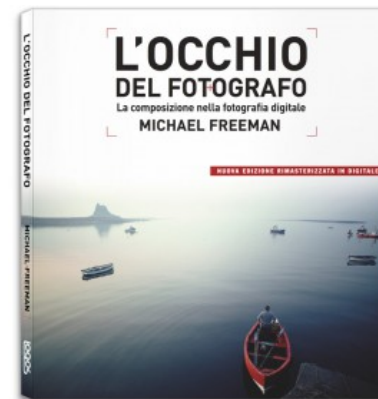
L'OCCHIO DEL FOTOGRAFO. LA COMPOSIZIONE NELLA FOTOGRAFIA DIGITALE - NEW EDITION