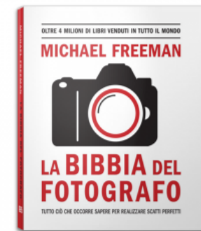
MICHAEL FREEMAN LA BIBBIA DEL FOTOGRAFO