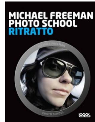
MICHAEL FREEMAN PHOTO SCHOOL RITRATTO