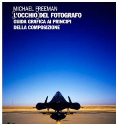
L'OCCHIO DEL FOTOGRAFO. GUIDA GRAFICA AI PRINCIPI DELLA COMPOSIZIONE