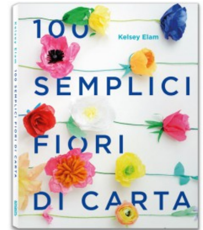
100 SEMPLICI FIORI DI CARTA