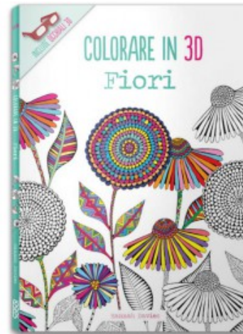
COLORARE IN 3D - FIORI

Holly Becker, Leslie Shewring 9788857606927 21,00€