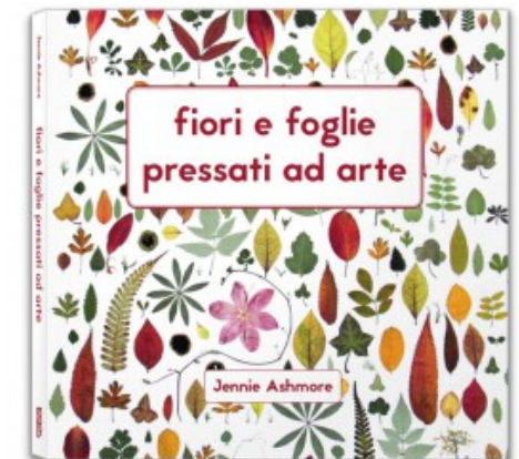
FIORI E FOGLIE PRESSATI AD ARTE