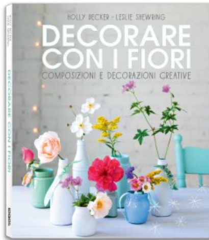
DECORARE CON I FIORI. COMPOSIZIONI E DECORAZIONI CREATIVE