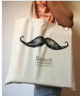
SHOPPER MUSTACCHI 18SHOPPERMUST 5,00€