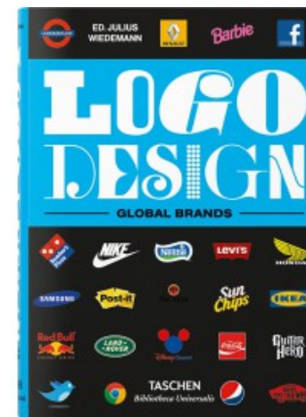
LOGO DESIGN. GLOBAL BRANDS