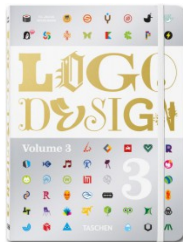
LOGO DESIGN 3 (IEP)