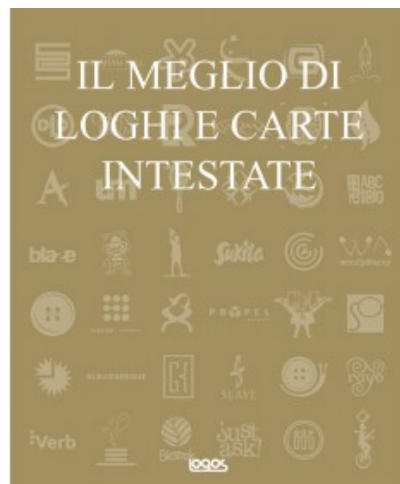
IL MEGLIO DI LOGHI E CARTE INTESTATE