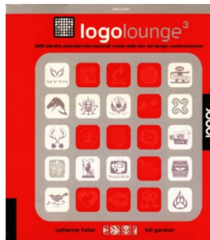
LOGOLOUNGE 3 MINI

Bill Gardener, Catharine Fishel 9788879406536 29.95€