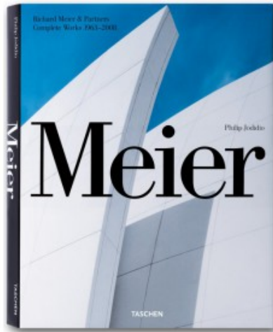
RICHARD MEIER & PARTNERS. COMPLETE WORKS 1963-2008