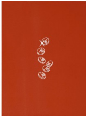
KOOLHAAS. GREAT LEAP FORWARD Rem Koolhaas 9783822860489 29,99€