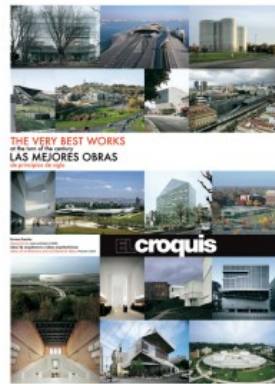
THE VERY BEST WORKS AT THE TURN OF THE CENTURY AA.VV. 9788488386663 112,00€