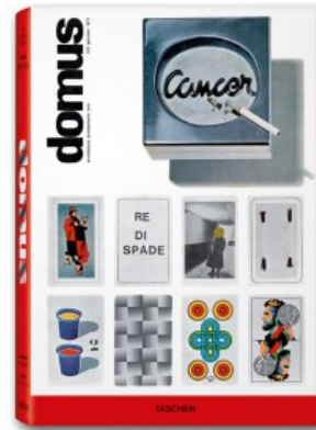
DOMUS VOL.7 Germano Celant, Luigi Spinelli 9783836509572 49,99€