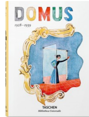
DOMUS 1930S Charlotte & Peter Fiell 9783836526524 15,00€