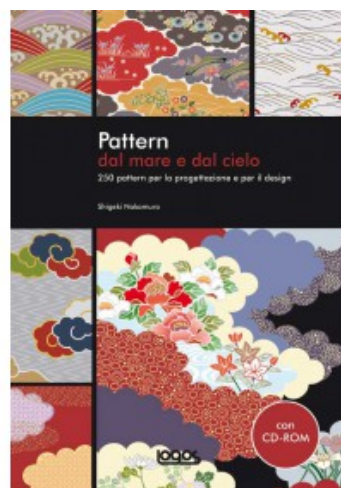
PATTERN DAL MARE E DAL CIELO