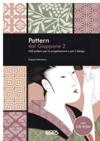
PATTERN DAL GIAPPONE 2