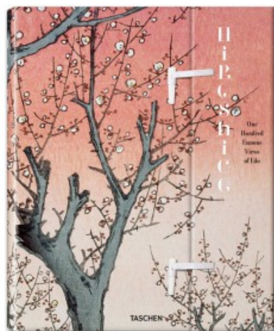
HIROSHIGE. CENTO FAMOSE VEDUTE DI EDO

Lorenz Bichler, Melanie Trede 9783836521680 30,00€