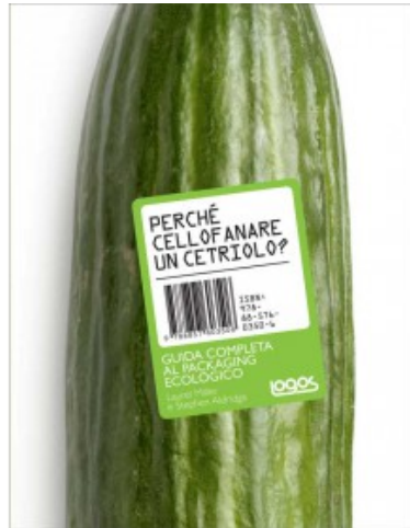
PERCHÈ CELLOFANARE UN CETRIOLO

Laurel Miller, Stephen Aldridge 9788857603506 34.95€