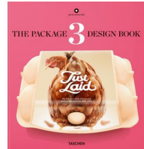
THE PACKAGE DESIGN BOOK 3

Julius Wiedemann, Pentawards 9783836553827 39.99€