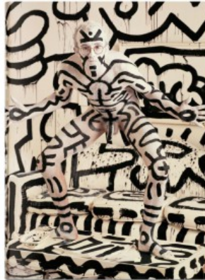
ANNIE LEIBOVITZ CON COPERTINA KEITH HARING - EDIZIONE LIMITATA