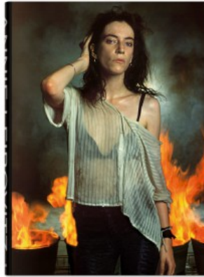
ANNIE LEIBOVITZ CON COPERTINA PATTI SMITH - EDIZIONE LIMITATA