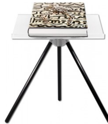
ANNIE LEIBOVITZ - ART EDITION