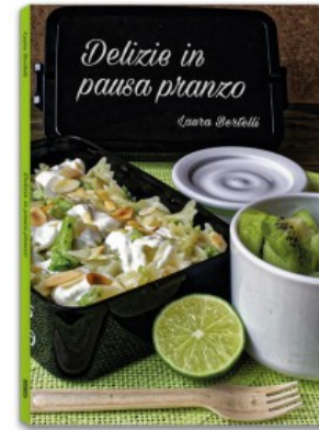
DELIZIE IN PAUSA PRANZO