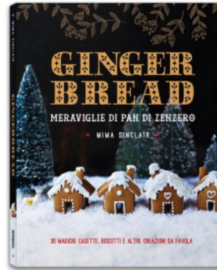
GINGERBREAD. MERAVIGLIE DI PAN DI ZENZERO