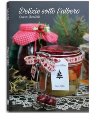
DELIZIE SOTTO L'ALBERO